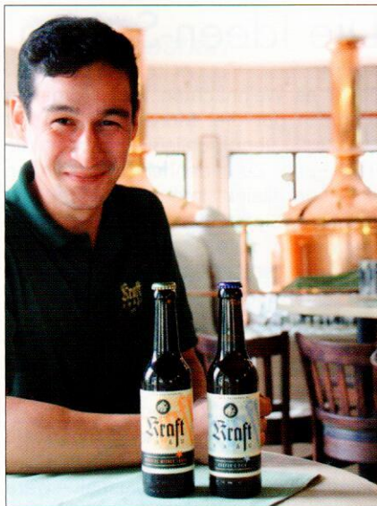
Umsetzung des Markenpakets beim Kraft Bräu/Hotel Blesius Garten in Trier

Möglichkeit, kleine Auflagen an Saison-, Editions- und Craftbieren am Markt zu etablieren. Es vereint die professionelle Gestaltung und Beratung des Markenauftritts am Point of Sale mit der Umsetzung auf eine bedarfsorientierte Kleinauflage von Etiketten, Kronenkorken, Bierdeckeln sowie Sommelierkelchen – und dies unkompliziert aus einer Hand.